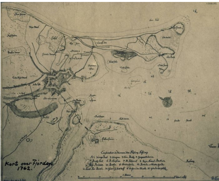
Kort over Fjorden og Nyborgs befæstning 1762

Den 14. september 1773 ankom en gruppe hvervede soldater af 2. bataljon Jyske Geworbne Infanteriregiment til købstaden Nyborg. Byen havde en fæstning, og soldaterne skulle gøre tjeneste her. Forskellige militære styrker skiftedes til, i slutningen af 1700-tallet, at bemane Danmarks fæstninger i kortere eller længere perioder. København og Rendsborg var de største, Nyborg var den tredjestørste og var under fælleskommando med Korsør. Man havde siden 1769 arbejdet med at oprette et fast garnisonskompagni for Nyborg Slot og Fæstning og i 1774 overtog ca. 150 mand tjenesten under navnet Nyborg Garnisonskompagni . En del af dem, som var ankommet året før med Jyske Geworbne Infanteriregiment, overgik til Garnisonskompagniet.