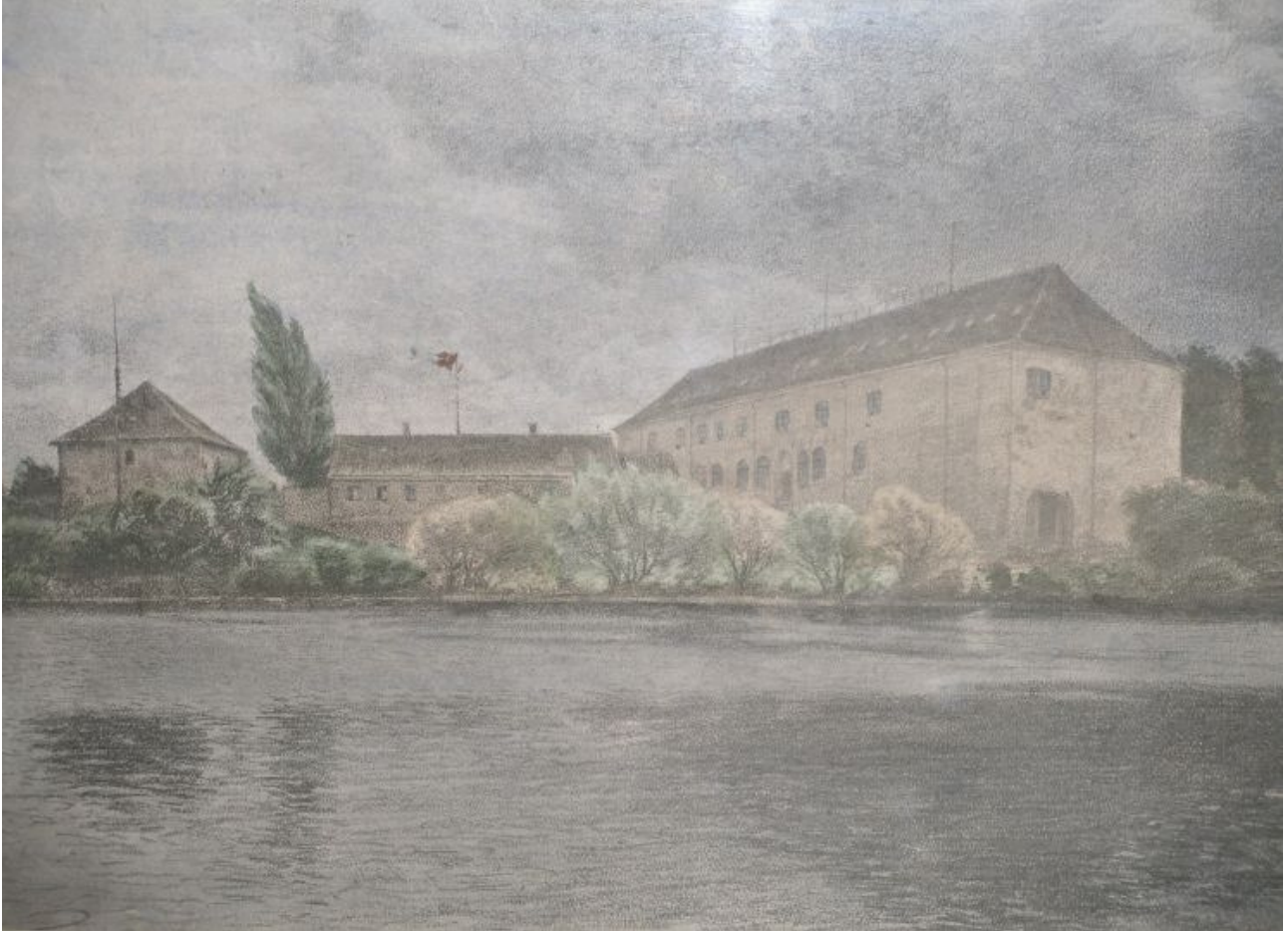
Nyborg Slot 1800-tallet.

forskning sig. Det er også her jeg har taget udgangspunkt: Nyborg Slot set som byens største arbejdsplads.