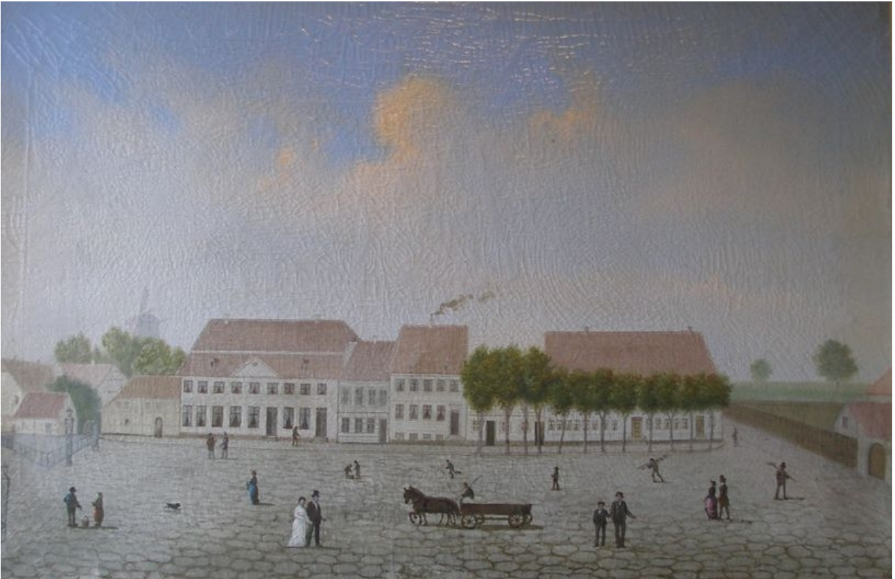
Nyborg Torv. Malet af en kaptajn i garnisonen (navn ukendt) ca. 1850