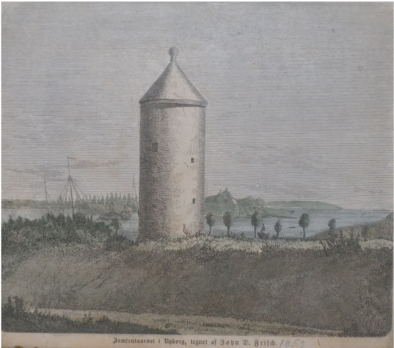
Krudttårnet som blev bevogtet af garnisonssoldater

Selv om garnisonkompagnier var for gamle og svagelige, betød den omstændighed at Nyborg garnisonkompagni var nyoprettet i 1774, at der også var unge familier med børn i blandt dem. Det har derfor været muligt at lave en undersøgelse med udgangspunkt i de tilvandrede udenlandske soldaterfamilier.