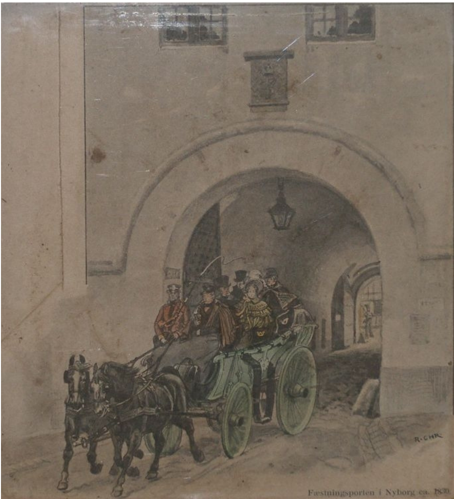
Fæstningsporten i Nyborg 1830. Inderst i billedet ses en musketer stå vagt.

I 1700-tallet bestod den danske hær primært af hvervede soldater, hvilket medførte at de kom fra såvel kongeriget Danmark, hertugdømmerne og resten af Europa. Nogen dybdegående undersøgelse af hvor mange ”udlændinge”, der gjorde tjeneste i hæren, er mig bekendt ikke foretaget, men i Nyborg Garnisonskompagni i 1801 udgjorde de 84 %. Nyborg købstad havde knap 2000 indbyggere, og da også andre kompagnier var indkvarteret i byen, betød det at ca. 1/3 af byens befolkning var soldater. Fremmede udgjorde altså en væsentlig del af byens indbyggere.