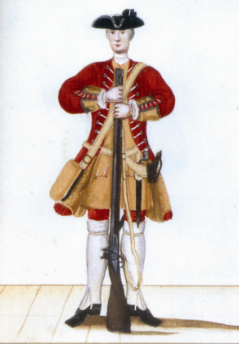
Musketer ( kilde: Tøjhusmuseet)

musketererne i garnisonskompagniet bliver fadder for civile børn, andre militære overordnede forekommer, men det er ikke nogen væsentlig del.